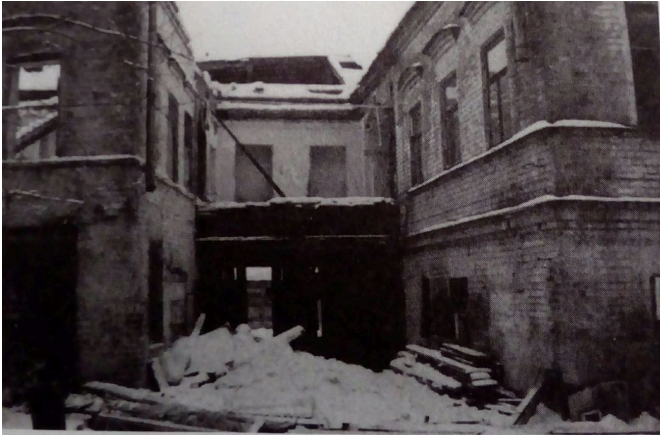
Рисунок 1. Коридор с 2 окнами соединяющий 2 здания, в котором жили люди с именем Рустем Яхин и Марьям Яхина (Мусина).

Вид со двора (см.: Рисунок 1) жилого дома №19 (дома товарищества Мусиных) на улице Парижской Коммуны. Между зданиями, в середине соединительного коридора, видны два окна. Именно там смогли приютить лишь маленького мальчика с именем Рустем с его матерью и сменем Марьям Яхиной (Мусиной). Они были выброшены в 1932 году вместе со всей семьей из своего дома №16 на улице Калинина. Остальные члены семьи — погибли, каждый своей судьбой, которая осталась неизвестной общественности (но мы знаем). Рустем Яхин с матерью прожили там 25 лет. Там же стоял спасённый и перевезённый рояль. И там же он написал концерт для фортепиано с оркестром, а также многие романы.